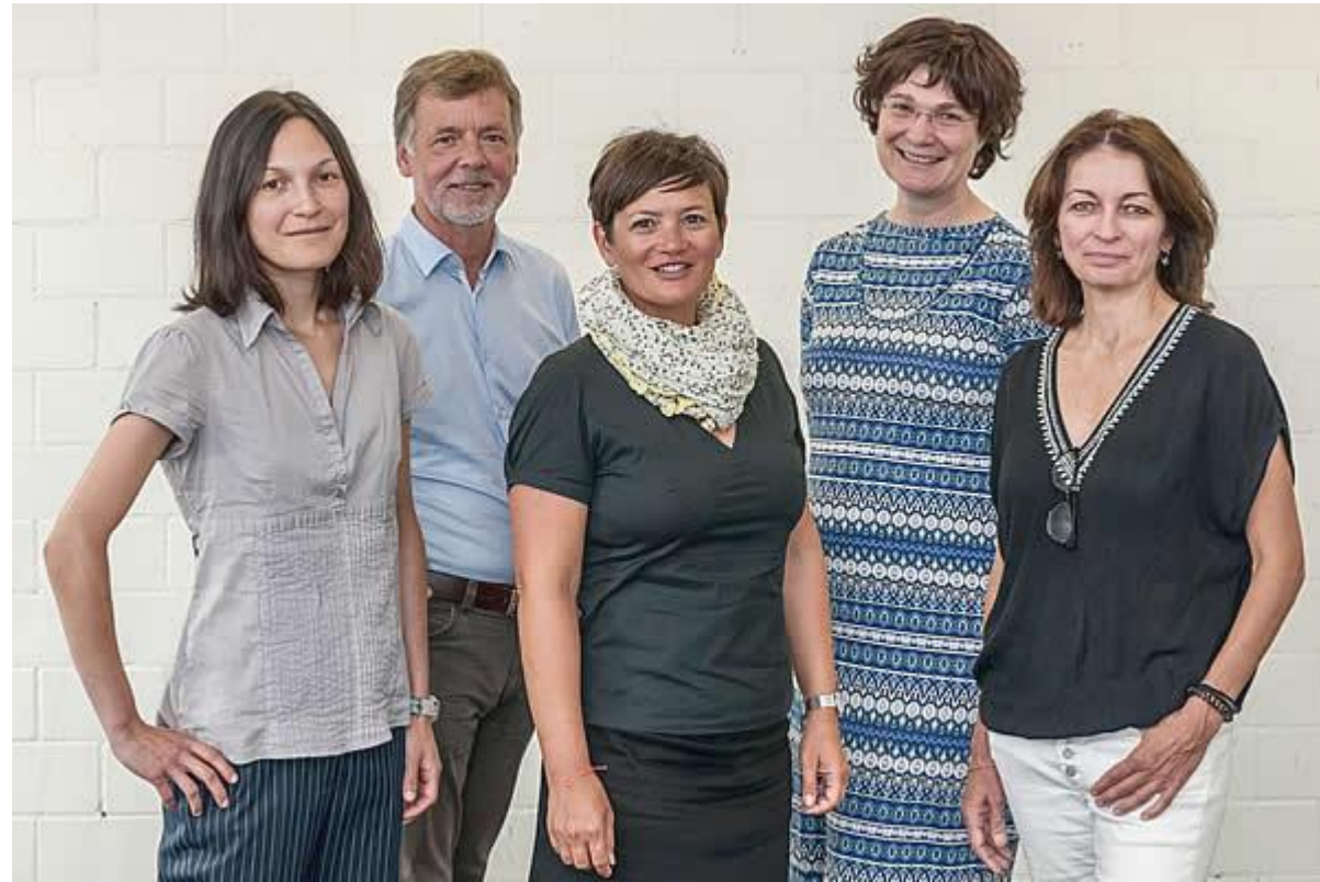
Das Projektteam 2019